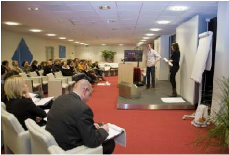
De presentatiezaal op de 16e etage.

Alles eindigt waar het begon. De creatieven spoeden zich naar het auditorium op de 16e verdieping. De vijfkoppige Rabojury wacht in spanning de resultaten af. Als iedereen zit, geeft de organisatie de teams een voor een het podium om hun ideeën te presenteren.