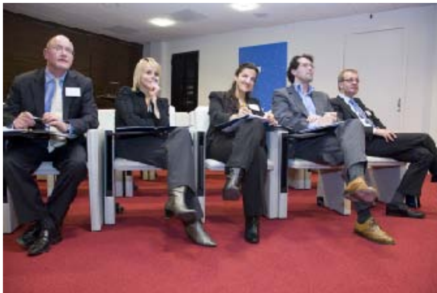
De jury van de Rabobank.